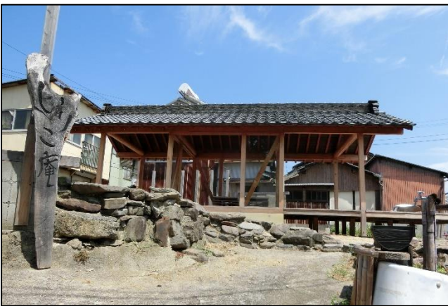
みかん組制作「いりこ庵」 （公民館から少し上の道沿い）